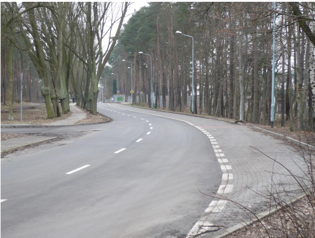
fotografia 17 Pętla przy ul Wyspiańskiego - pas postojowy