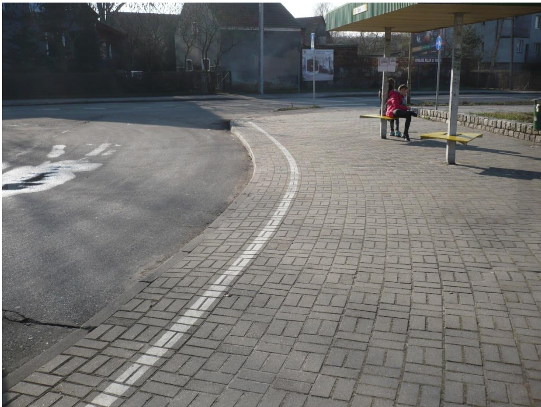
fotografia 22 Pętla przy ul. Truskawkowej - przystanek dla wsiadających