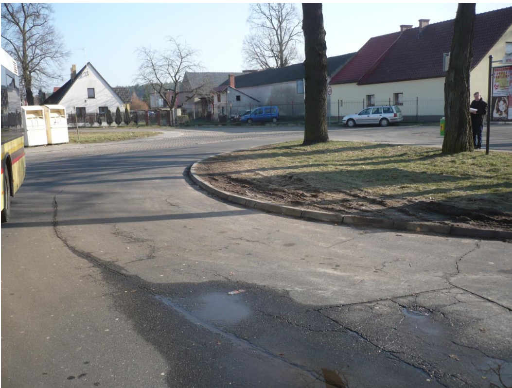
fotografia 24 Pętla przy ul Truskawkowej - plac postojowy