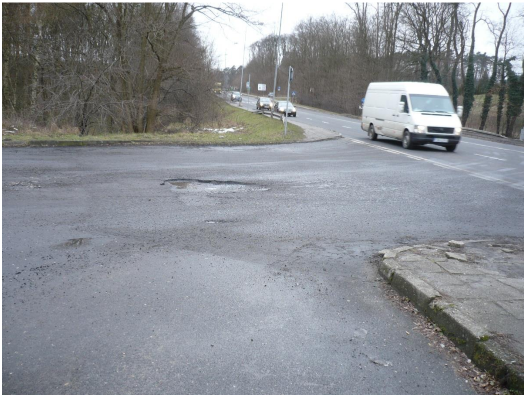
fotografia 7 Pętla przy ulicy Wrocławskiej - wyjazd z pętli