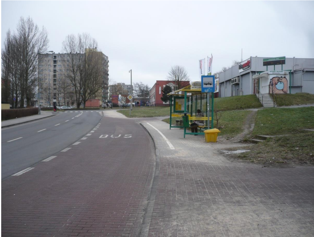
fotografia 21 Pętla przy ul Zawadzkiego - przystanek dla wsiadających