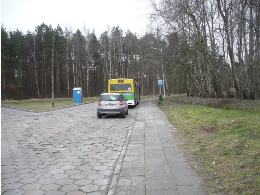
fotografia 10 Pętla przy ul Os Śląskie - przystanek dla wysiadających