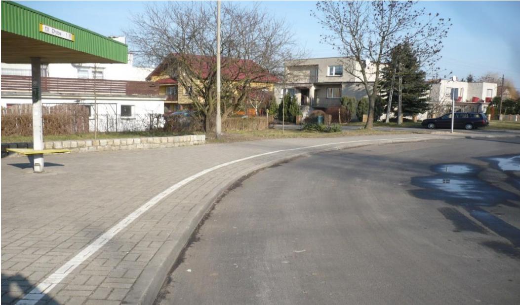
fotografia 23 Pętla przy ulicy Truskawkowej przystanek dla wysiadających i wsiadających