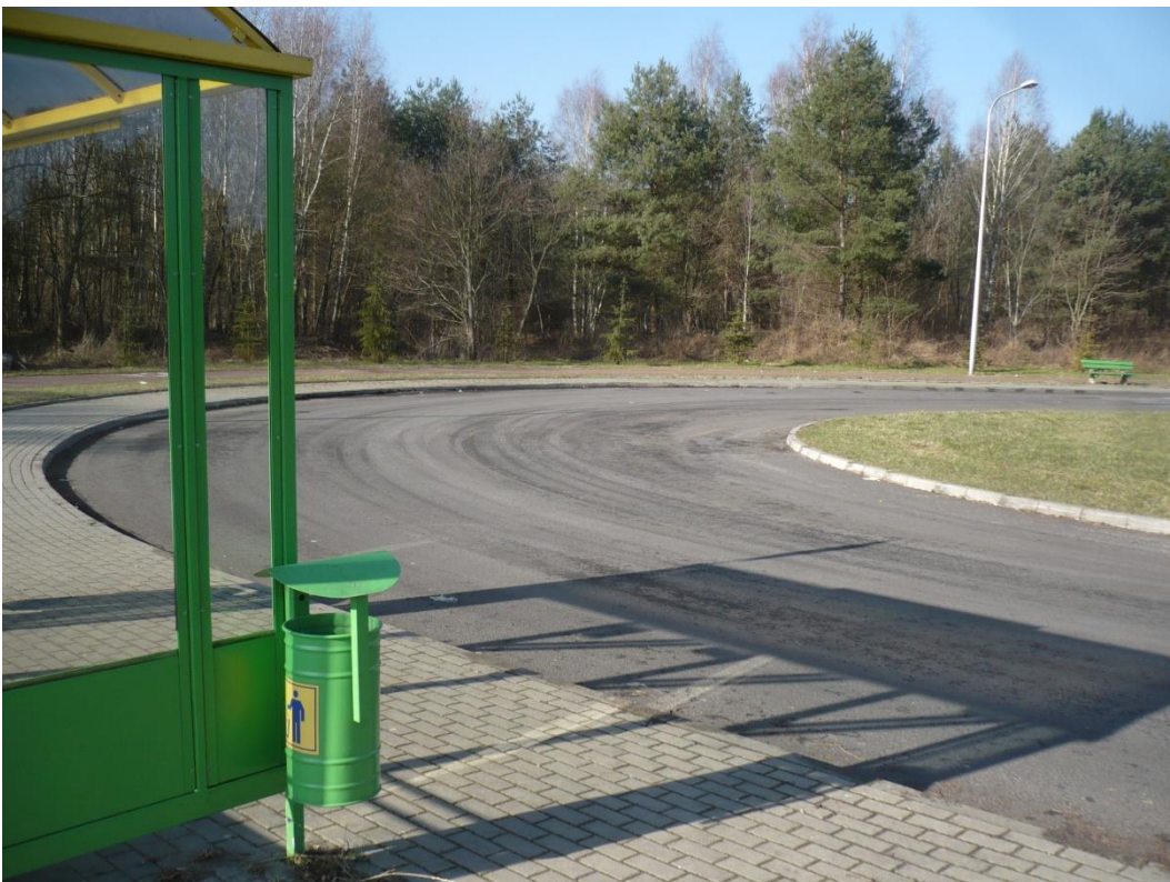
fotografia 13 Pętla przy ul. Jędrzychowskiej - przystanek dla wsiadających