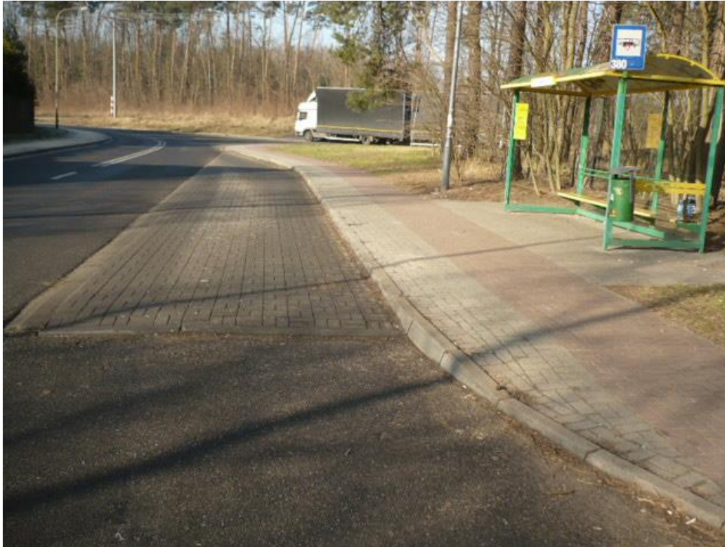
fotografia 6 Pętla przy ul. Świerkowej - przystanek dla wsiadających