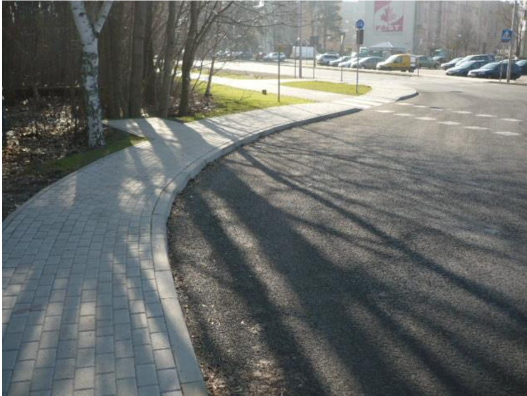
fotografia 2 Pętla przy ulicy Batorego – miejsce do zawracania