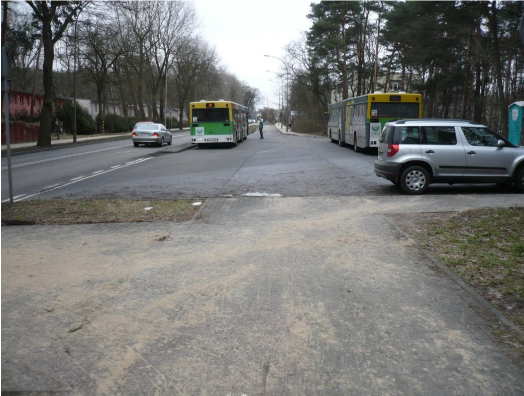
fotografia 12 Pętla przy ul Botanicznej - miejsce postojowe