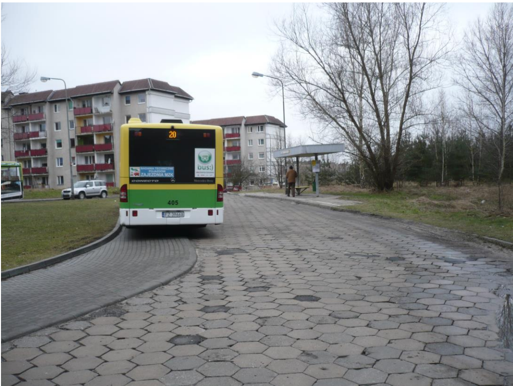
fotografia 9 Pętla przy ul. Os Śląskie - miejsce postojowe z przystankiem dla wsiadających