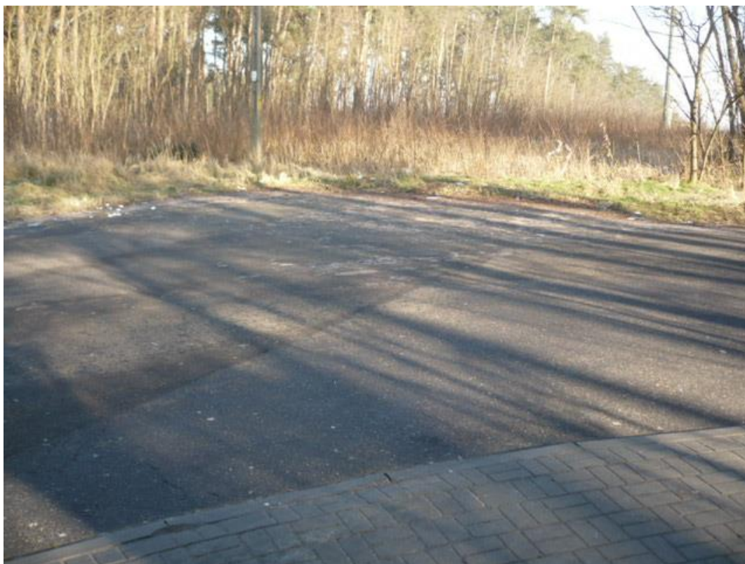
fotografia 4 Pętla przy ul. Świerkowej - miejsce do zawracania