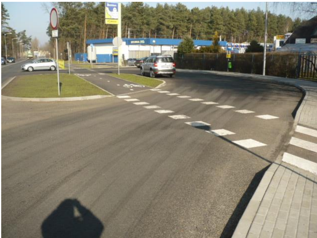
fotografia 3 Pętla przy ulicy Batorego - miejsce do zawracania z przystankiem dla wsiadających