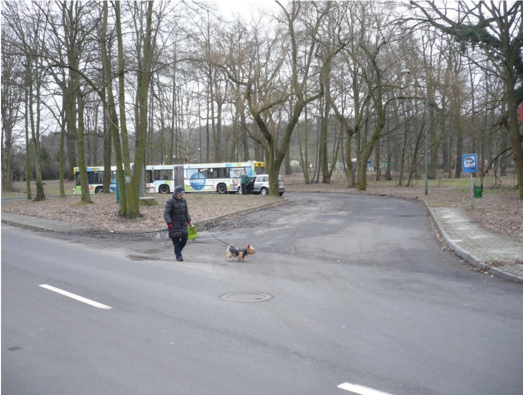
fotografia 16 Pętla przy ul. Wyspiańskiego – miejsce do zawracania