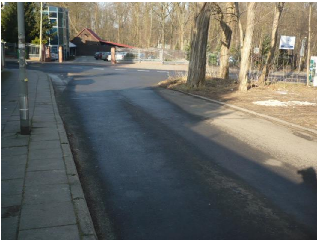
fotografia 27 Pętla przy ul Wyczołkowskiego - wjazd