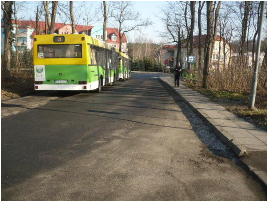
fotografia 26 Pętla przy ul Wyczółkowskiego - miejsce postoju, przystanek dla wsiadających