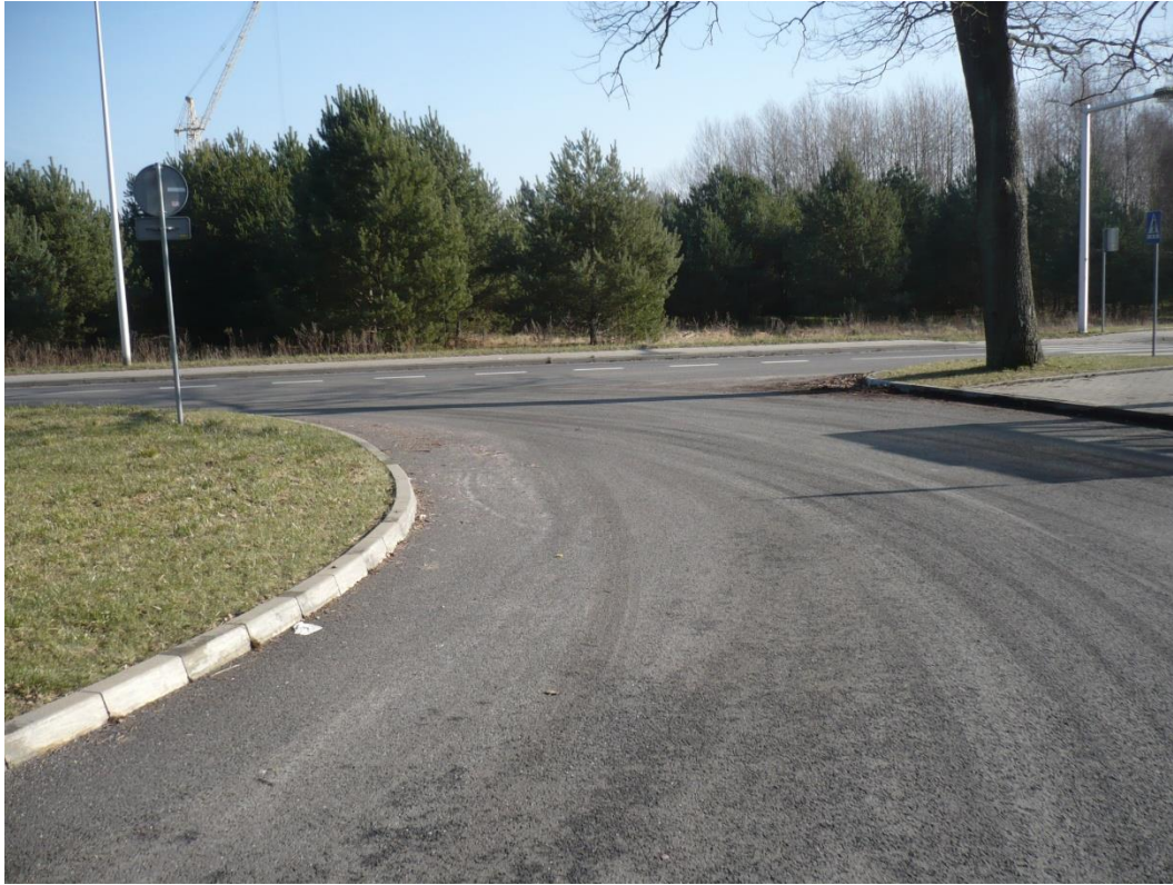
fotografia 14 Pętla przy ul. Jędrzychowskiej - wyjazd