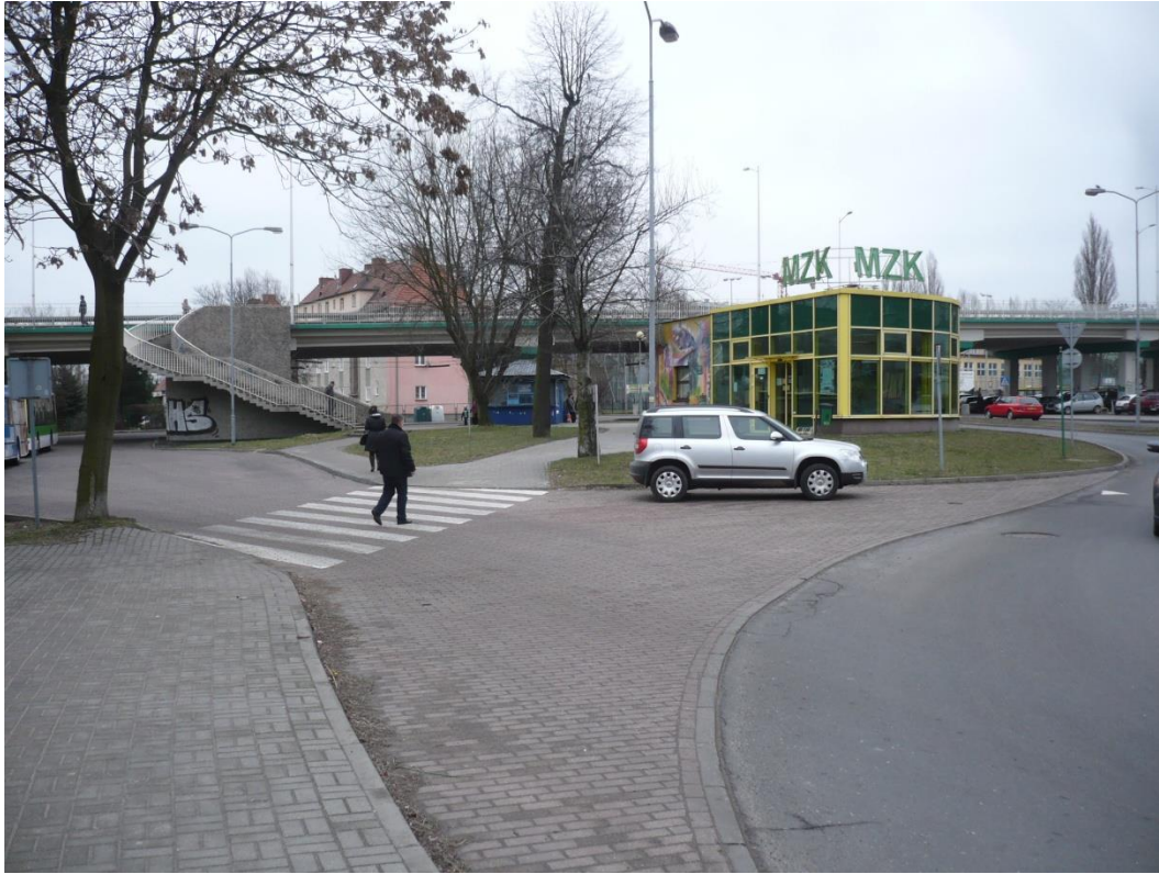
fotografia 18 Pętla przy ul Bema (planowane miejsce budowy Centrum Przesiadkowego)