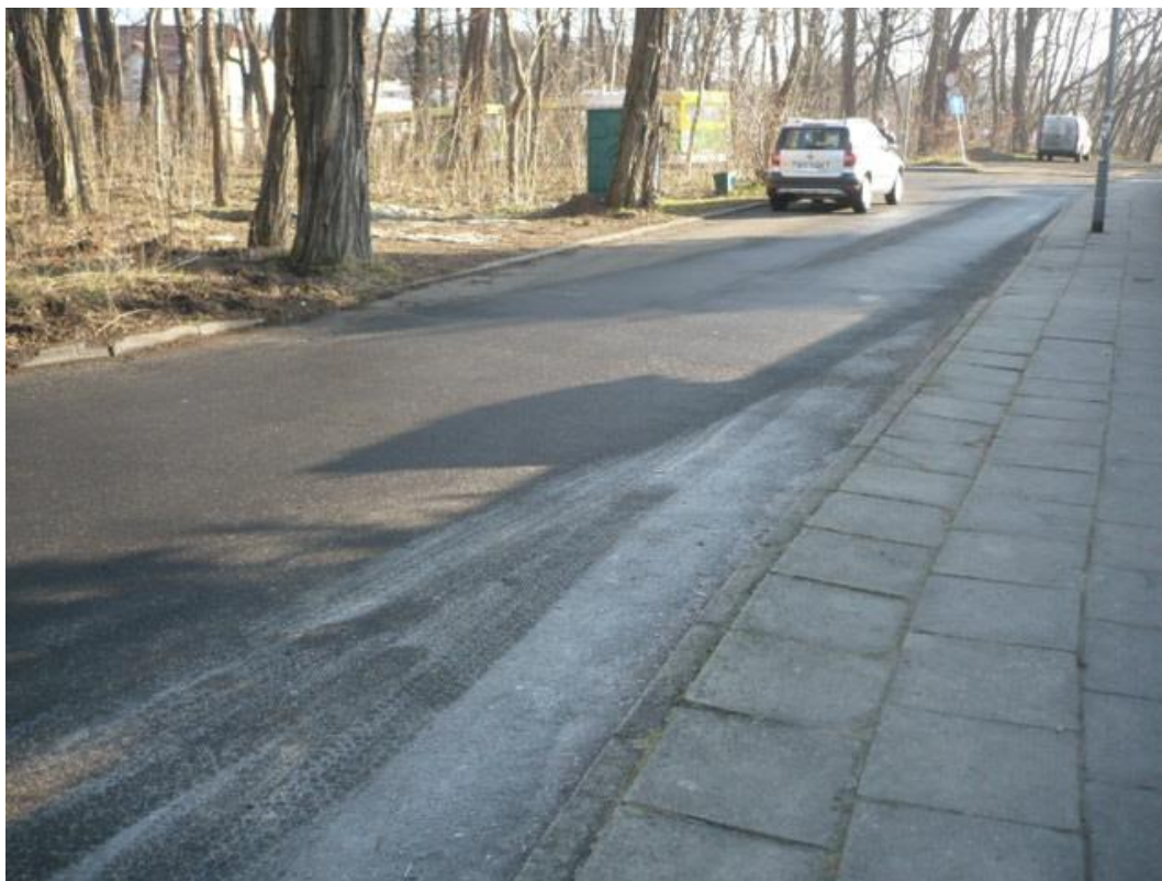
fotografia 28 Pętla przy ul Wyczołkowskiego miejsce postoju