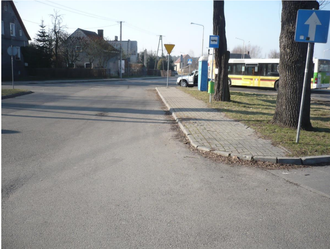
fotografia 25 Pętla przy ul Truskawkowej - przystanek przejazdowy