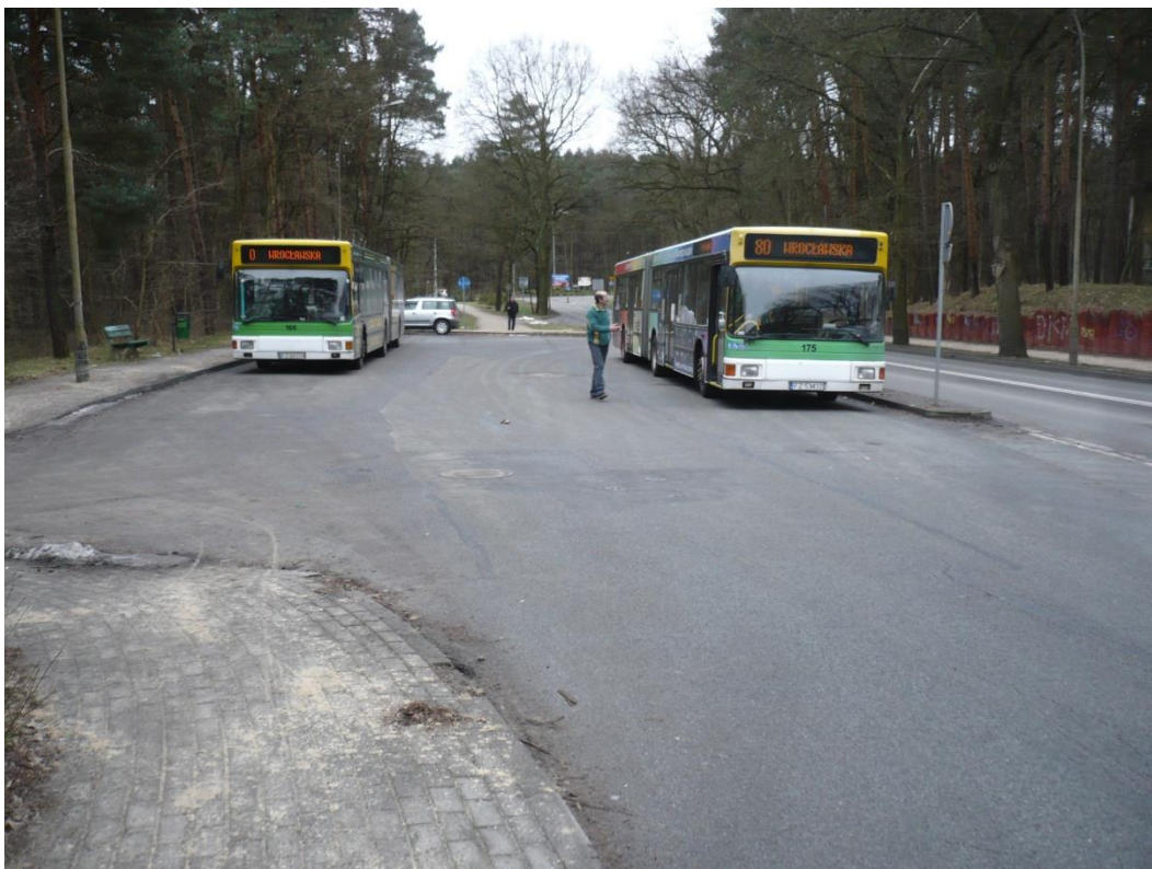
fotografia 11 Pętla przy ul Botanicznej - miejsce postojowe