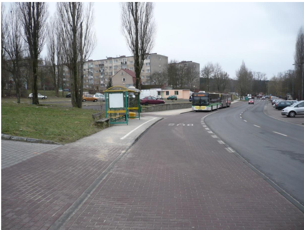
fotografia 20 Pętla przy ul. Zawadzkiego pas postojowy