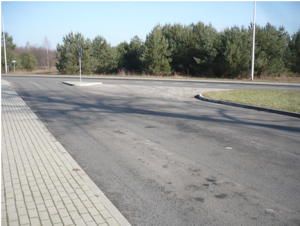
fotografia 15 Pętla przy ul. Jędrzychowskiej wjazd