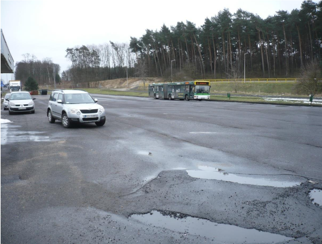
fotografia 8 Pętla przy ul. Wrocławskiej - miejsce postojowe