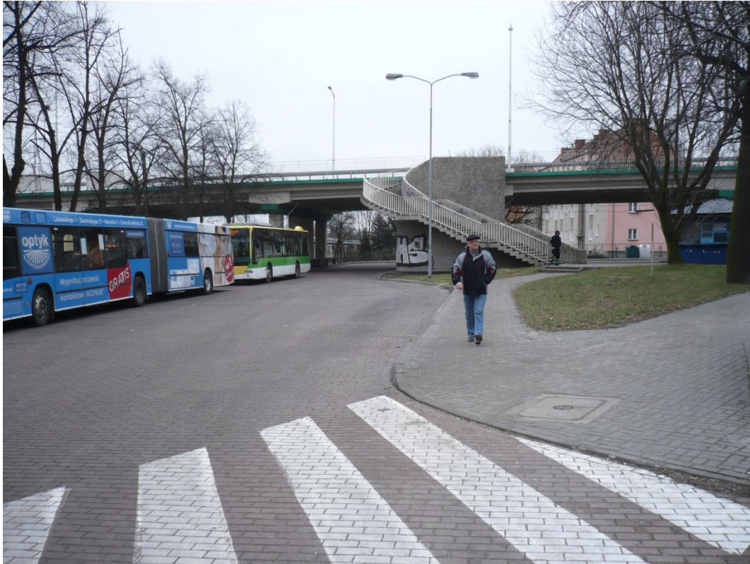
fotografia 19 Pętla przy ul Bema (planowane miejsce budowy Centrum Przesiadkowego)