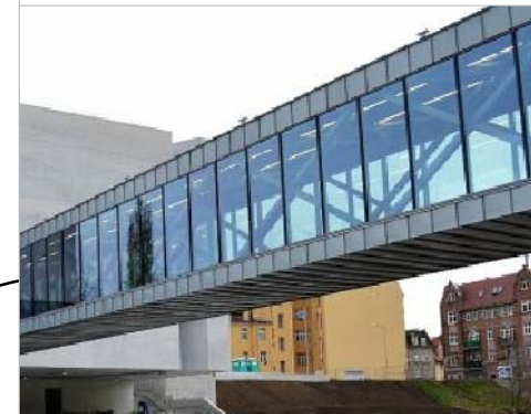
KONSTRUKCJA KŁADKI