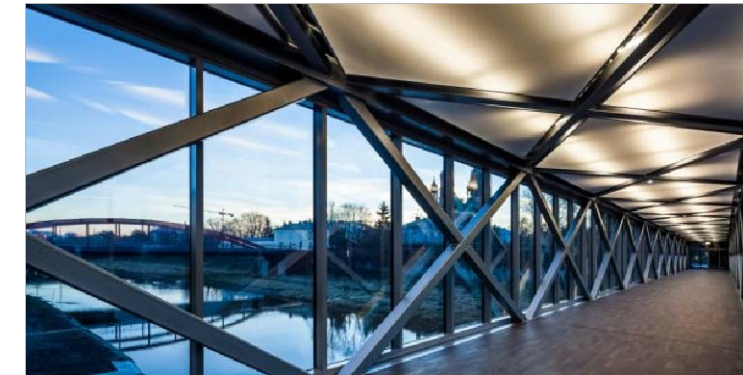
fot. Ad Artis Architects KONSTRUKCJA KŁADKI