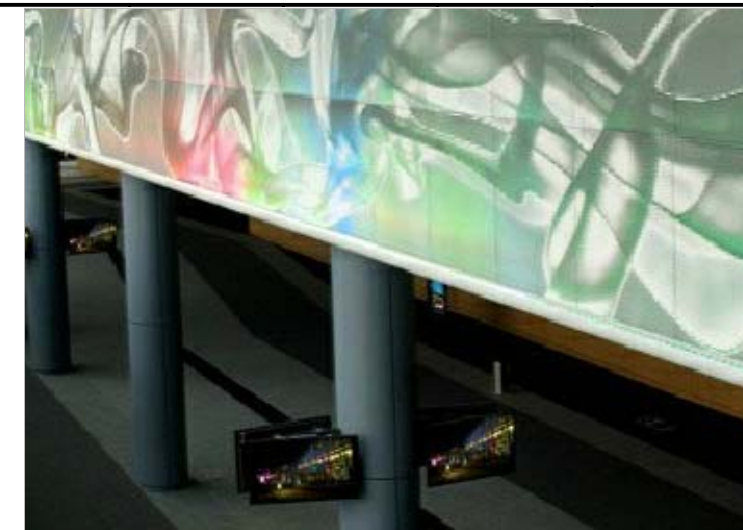
fot. http://www.energopuls.pl/illuminacja-led BANDA ŚWIETLNA